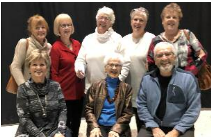
Membres gagnants des tirages