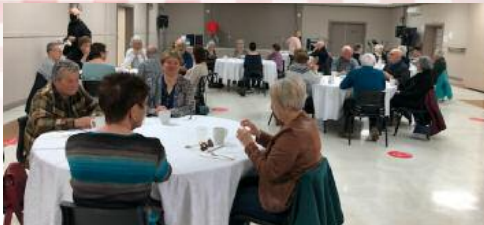
Il n'y avait qu'un peu plus d'une trentaine de personnes à notre déjeuner mais le son des belles conversations donnait l'impression que nous étions une centaine de personnes!

Malgré tous les inconvénients du Covid, nos activités régulières continuent de plus belle. Nous nous sommes donc regroupés le 7 avril dernier au Centre Culturel de Paquetville pour un déjeuner style Cabane à Sucre. Malgré une faible diminution du nombre de participants, ceux présents ont beaucoup appréciés la rencontre et sont restées jaser plus d'une heure après la fin du déjeuner. Des retrouvailles qui font du bien par les temps qui courts. Et, évidemment, la bonne humeur était au rendez-vous autour de l'excellente nourriture préparée par l'équipe de M. Jean-Luc Jean.