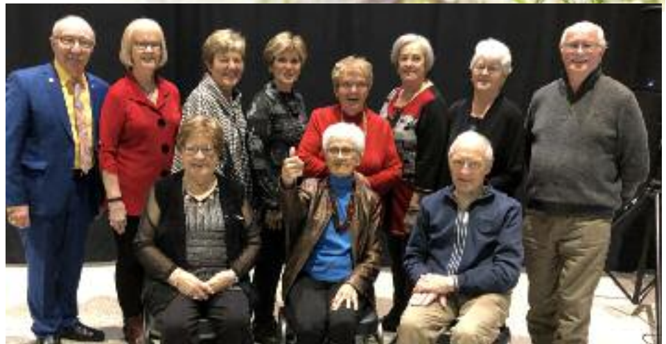
Les jubilaires 2021